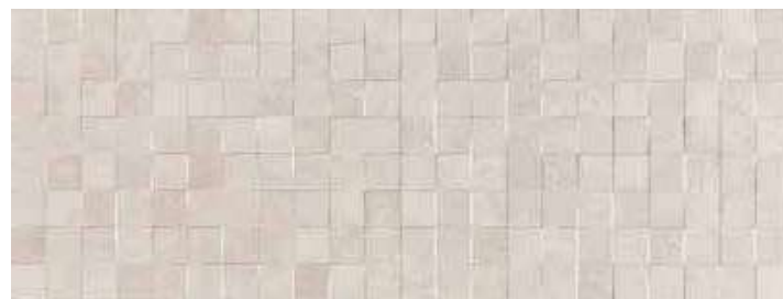
MOSAICO TOSCANA BONE 45x120x1cm P3580017 / 100200318 G274 Butech recomienda junta / Butech recommends joint: Colorstuk Rapid n Gris B22502013 / 100004305