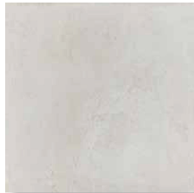
TOSCANA STONE S-R 59,6x59,6x1,1cm P1857029 / 100190065 G354 Butech recomienda junta / Butech recommends joint: Colorstuk Rapid n Gris B22502013 / 100004305