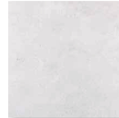
PORTLAND CALIZA S-R 59,6x59,6x1,1cm P1856855 / 100135548 G354 Butech recomienda junta / Butech recommends joint: Colorstuk Rapid n Gris B22502013 / 100004305