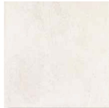
TOSCANA CALIZA S-R 59,6x59,6x1,1cm P1857031 / 100190077 G354 Butech recomienda junta / Butech recommends joint: Colorstuk Rapid n Gris B22502013 / 100004305