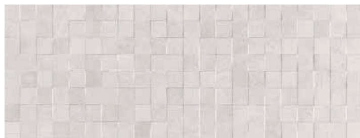
MOSAICO TOSCANA CALIZA 45x120x1cm P3580018 / 100200329 G274 Butech recomienda junta / Butech recommends joint: Colorstuk Rapid n Gris B22502013 / 100004305