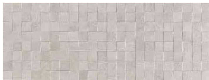
MOSAICO TOSCANA STONE 45x120x1cm P3580019 / 100200335 G274 Butech recomienda junta / Butech recommends joint: Colorstuk Rapid n Gris B22502013 / 100004305