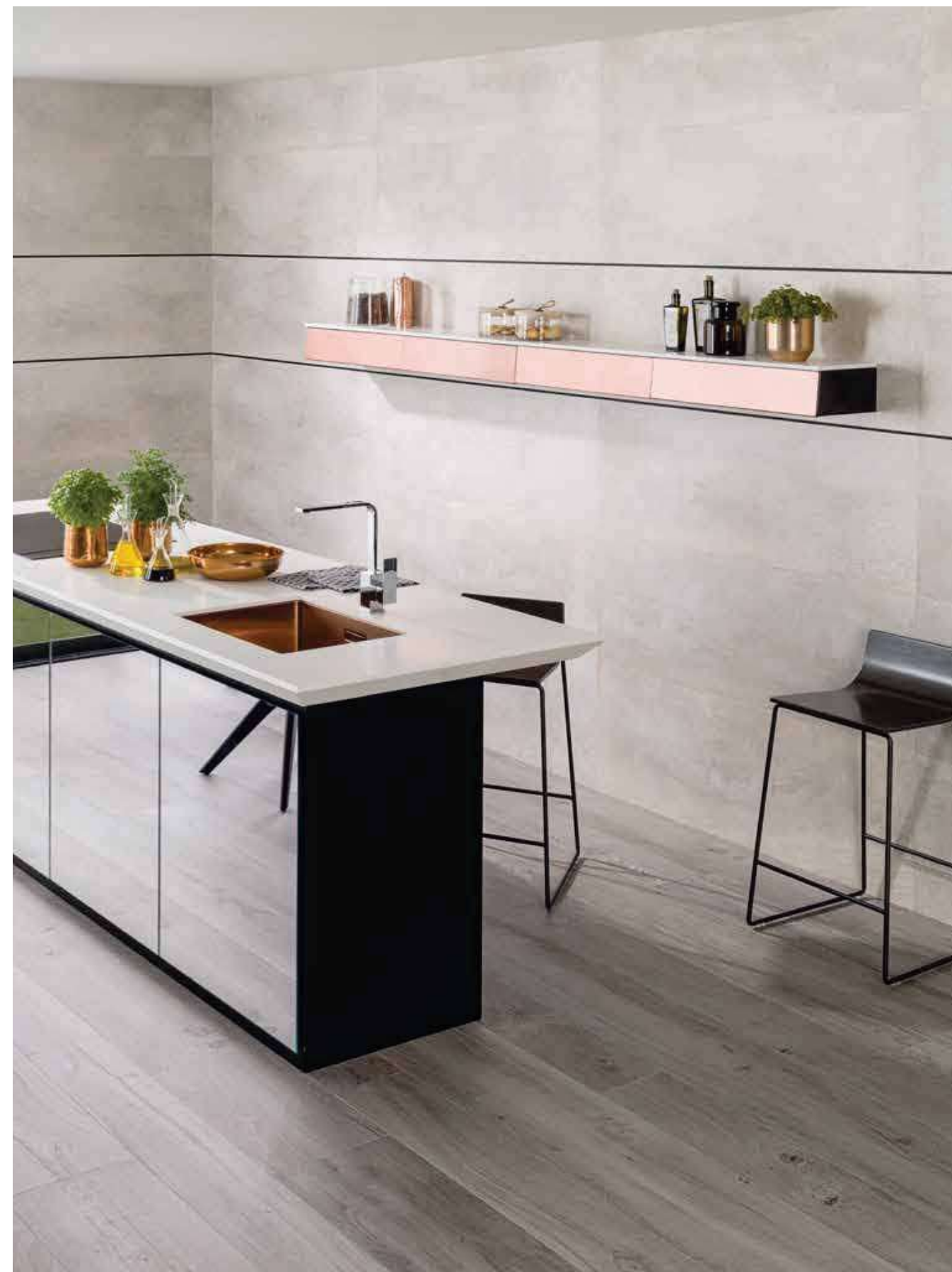
# TOSCANA STONE 45x120cm