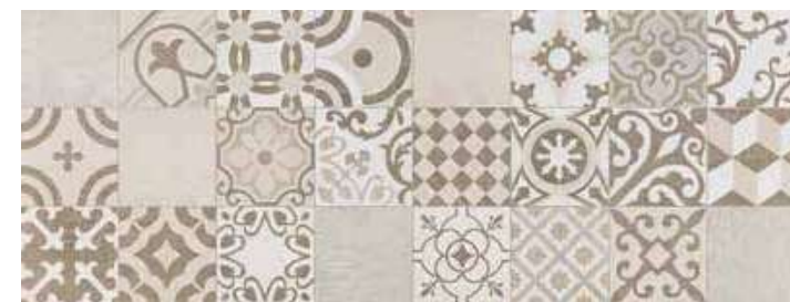
TOSCANA DECO 45x120x1cm P3580020 / 100200342 G274 Butech recomienda junta / Butech recommends joint: Colorstuk Rapid n Gris B22502013 / 100004305