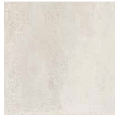
TOSCANA BONE S-R 59,6x59,6x1,1cm P1857030 / 100190103 G354 Butech recomienda junta / Butech recommends joint: Colorstuk Rapid n Gris B22502013 / 100004305