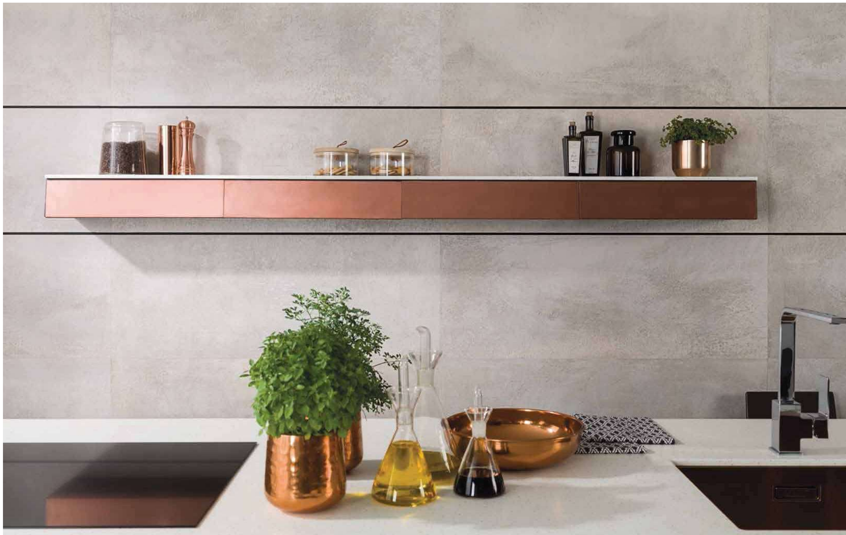
#TOSCANA STONE 45x20cm